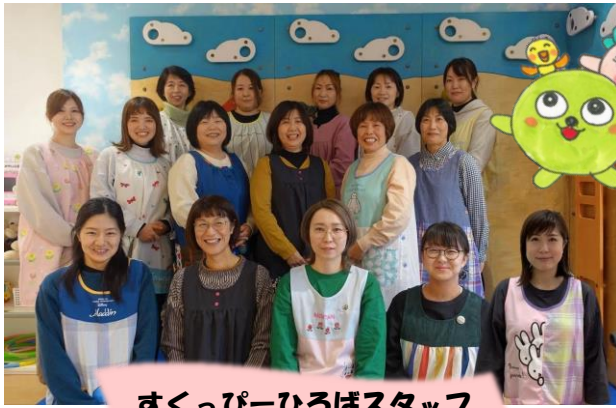
すくっぴーひろばスタッフ

日頃より、すくっぴーひろばの運営にご理解・ご協力いただきありがとうございます。おかげさまで、新しい年を迎えることができ、職員一同うれしく思っています。