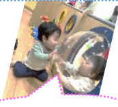
お友だちがいるよ!

「すくっぴータイム」絵本の読み聞かせや手遊び、親子で触れ合っただ遊んでみよう! お家でもできる遊びも紹介します