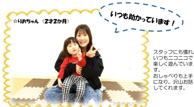
☆りおちゃん (2才2か月)