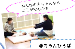
ねんねの赤ちゃんならここが安心かも